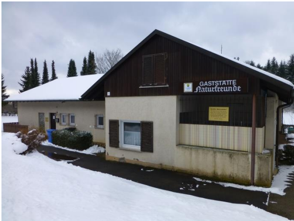
Massenlager bis 40 Personen