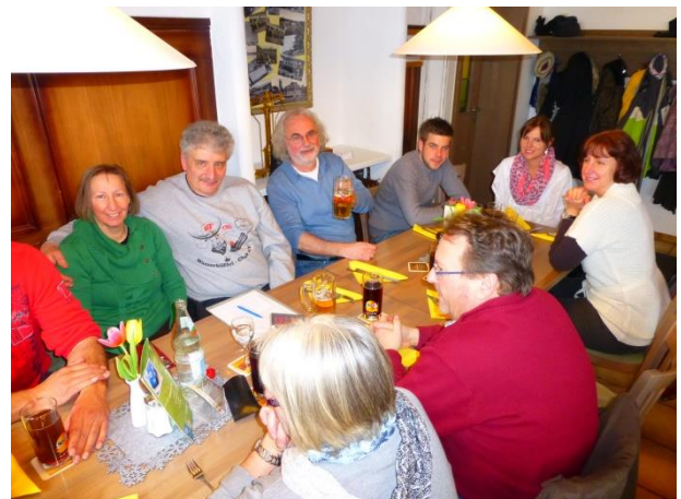
für lustige Stimmung sorgt der Stammtisch Stuttgart