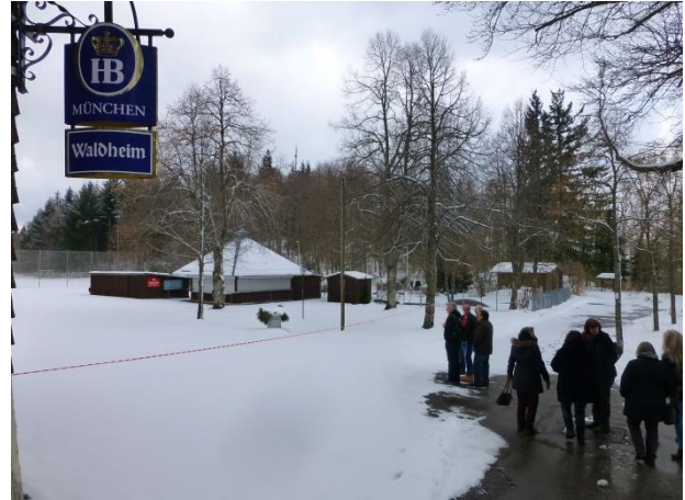
für den Hunger zwischendurch der Kiosk