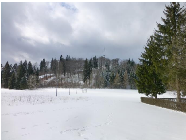
Zeltplatz für die Hartgesottenen