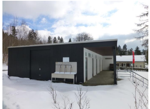
sanitäre Anlagen rund um die Uhr