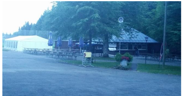
Kiosk mit Festzelt 🍺 🍺 🍺 🍺 🍺