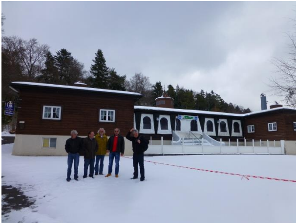
für die Verpflegung sorgt das Waldheim